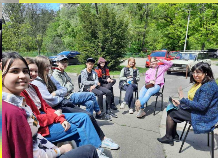
Проведення занять, коли в школі дуже холодно

твердження), бо в навчанні сольфеджіо все ж необхідним є «живе» спілкування, але нам потрібно вдосконалюватися в дистанційних формах, таких незвичних для мого покоління, ділитися досвідом, шукати, знаходити та перемагати.